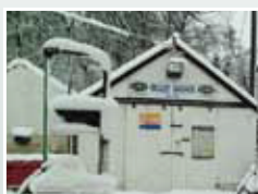
станции тех обслуживания