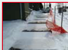
подъемы и спуски